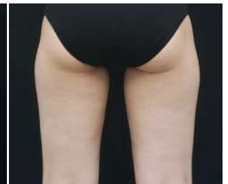
24 Hafta Sonra / 1 Seans