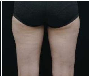
6 Hafta Sonra / 1 Seans